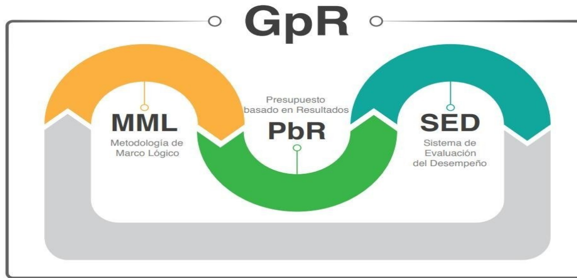
Figura 2. Componentes de la Gestión para Resultados

..... Fuente: Transparencia y rendición de cuentas/SHCP.